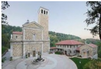
The Shrine of Our Lady of Guadalupe, La Crosse, WI

Saint Patrick Church invites you on a pilgrimage on August 19, Saturday, to the Shrine of Our Lady of Guadalupe in La Crosse, WI.